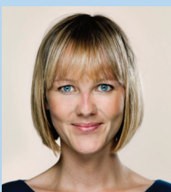
Ida Auken, tidl. miljøminister, Radikale